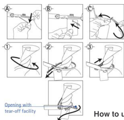
How to use