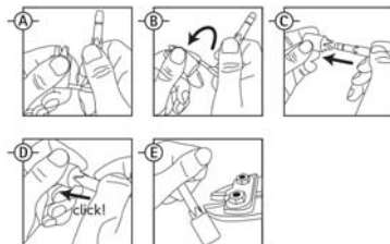
How to use