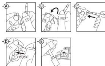
How to use